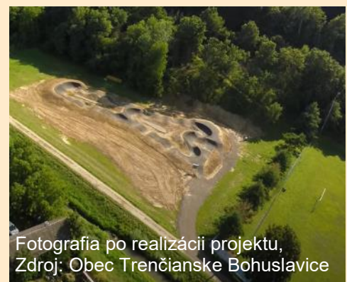
Fotografia po realizácii projektu

Predmetom projektu bolo vybudovanie pumptrackovej dráhy v obci Trenčianske Bohuslavice, pričom jeho realizácia viedla k zvýšeniu atraktivity obce a k zvýšeniu kvality života občanov. Projekt vyplýva z potrieb obce zabezpečiť vhodnú estetickú a bezpečnú občiansku vybavenosť a kvalitnú verejnú infraštruktúru slúžiacu na oddych a zábavu.