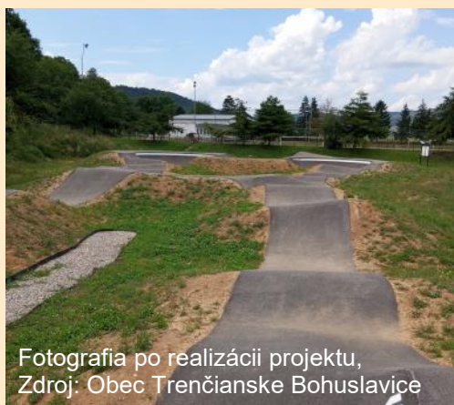
Fotografia po realizácii projektu

Predmetom projektu bolo vybudovanie pumptrackovej dráhy v obci Trenčianske Bohuslavice, pričom jeho realizácia viedla k zvýšeniu atraktivity obce a k zvýšeniu kvality života občanov. Projekt vyplýva z potrieb obce zabezpečiť vhodnú estetickú a bezpečnú občiansku vybavenosť a kvalitnú verejnú infraštruktúru slúžiacu na oddych a zábavu.