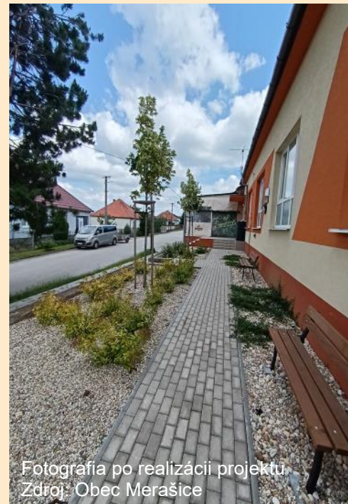
Fotografia po realizácii projektu

vyhovujúci. Novorekonštruované chodníky plnia funkciu architektonickú, estetickú a ich cieľom bolo skvalitnenie stavu verejnej infraštruktúry, oživenie obce zlepšením pohybu občanov na peších komunikáciách.