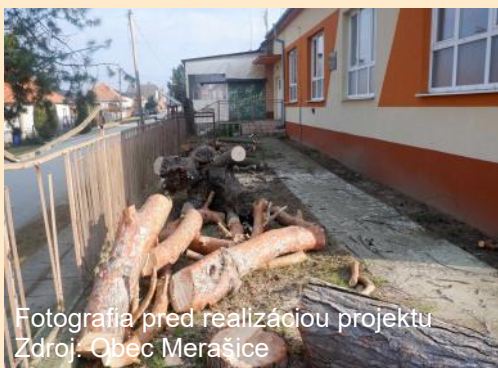
Fotografia pred realizáciou projektu

Predkladaný projekt riešil rekonštrukciu miestnej komunikácie v obci Merašice. Celá koncepcia rekonštrukcie vychádzala z existujúceho stavu chodníkov, ktorý nebol