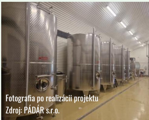
Fotografia po realizácii projektu

Predmetom projektu bol súbor technológií a zariadení do vinárskeho podniku, ktorý je hlavnou časťou celého výrobného procesu pri výrobe červených a ríbežľových vín.