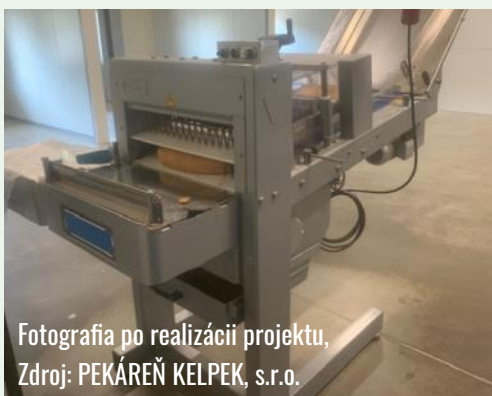
Fotografia po realizácii projektu, Zdroj: PEKÁREŇ KELPEK, s.r.o.

Cieľom projektu bolo posilniť konkurencieschopnosť spracovateľského a potravinárskeho priemyslu, zvyšovanie podielu domácej produkcie, zavádzanie technológií a postupov s cieľom vytvoriť nové alebo kvalitnejšie výrobky, posilniť inováciu potravinárskeho a spracovateľského priemyslu – zavádzaním inovatívnych technológií do výroby a zavádzaním inovatívnych postupov.