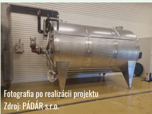
Fotografia po realizácii projektu

Predmetom projektu bol súbor technológií a zariadení do vinárskeho podniku, ktorý je hlavnou časťou celého výrobného procesu pri výrobe červených a ríbežľových vín.