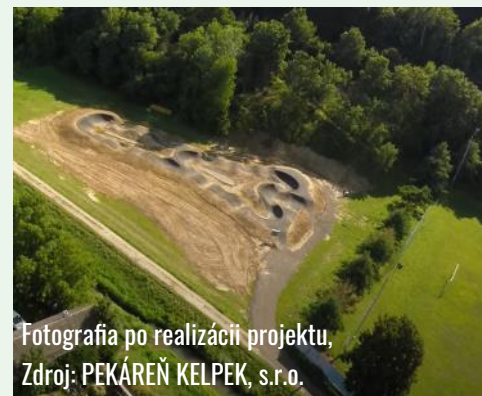
Fotografia po realizácii projektu

Cieľom projektu bolo posilniť konkurencieschopnosť spracovateľského a potravinárskeho priemyslu, zvyšovanie podielu domácej produkcie, zavádzanie technológií a postupov s cieľom vytvoriť nové alebo kvalitnejšie výrobky, posilniť inováciu potravinárskeho a spracovateľského priemyslu – zavádzaním inovatívnych technológií do výroby a zavádzaním inovatívnych postupov.