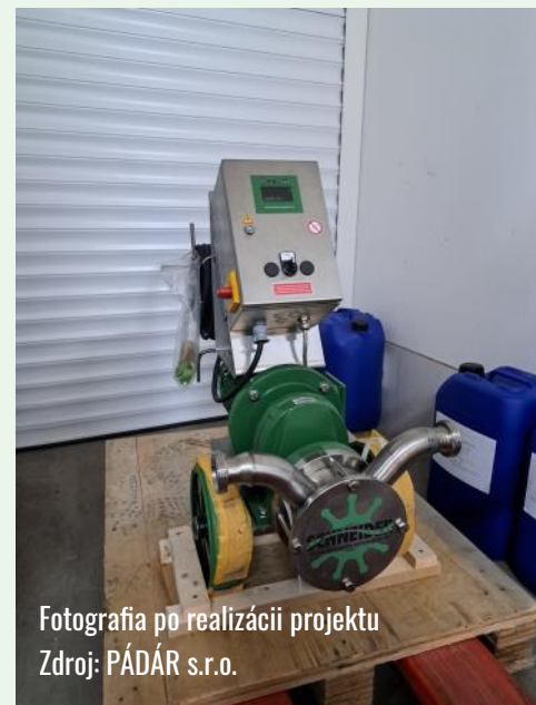
Fotografia po realizácii projektu

Zakúpením nových zariadení sa vo výrobnom procese docielila automatizácia, inovácia a zvýšenie kvality výrobkov, zvýšila sa efektivita výroby vína, kvalita vína, časová úspora, znížili sa straty v ovocnom sade z dôvodu prezretia ovocia a umožnilo sa dlhšie skladovanie a zrenie vína.