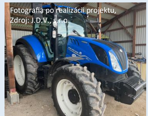
Fotografia po realizácii projektu

Nákupom sa pomohlo zabezpečiť vlastnou modernou technikou plynulý chod živočíšnej výroby, zvýšiť úroveň produktivity práce, eliminovať riziko porúch a prestojov, zvýšiť presnosť jednotlivých prác.