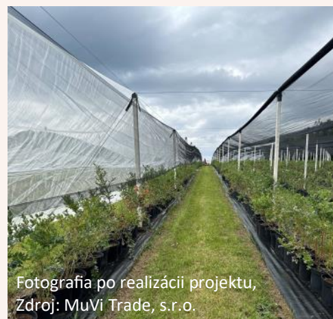
Fotografia po realizácii projektu, Zdroj: MuVi Trade, s.r.o.

Systém výrazne chráni pred škodami spôsobenými krupobitím. Zabráni trvalému poškodeniu rastlín a zníži riziko kolísania výnosov v dôsledku škôd z krupobitia. Umožní optimálnu a cieleňú ochranu rastlín.